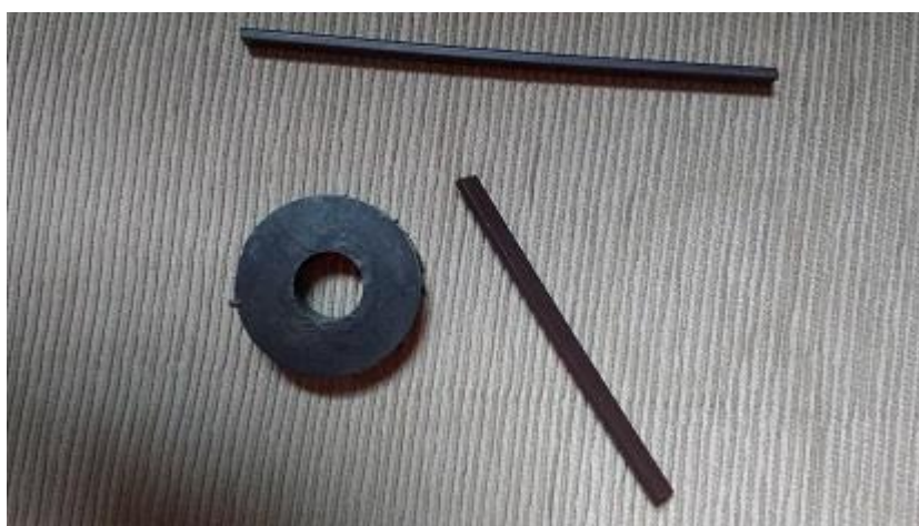
Figura 5: Ímãs para montagem do gerador de energia magnético.

Etapa 2: Montar o protótipo usando ímãs e sucata.