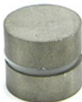
Figura 2: Dois ímãs em atração

Pegando dois ímãs, podemos fazer dois testes para colocar em prática a energia magnética. Primeiro teste, colocamos os dois ímãs, um ao lado do outro, com um lado (pólo) sul virado para um lado (polo) norte. Percebemos que os ímãs se atraem, em um ciclo contínuo.