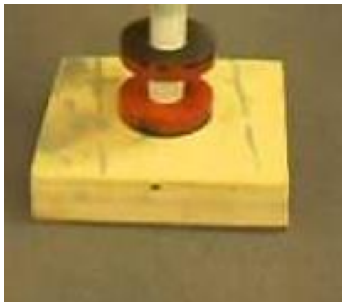
Figura 3 - Dois ímãs em repulsão

Já no segundo teste, se colocarmos os dois ímãs, um ao lado do outro, os dois virados para si com os mesmos pólos (sul virado para sul, ou norte virado para norte), podemos perceber que eles se afastam, não se atraem, e é perceptível uma energia que não deixa eles se juntarem.